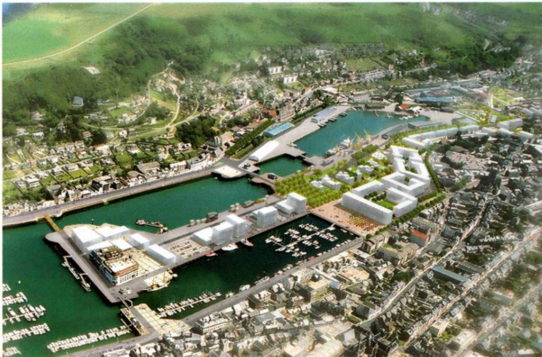
Un projet ambitieux respectueux du contexte urbain